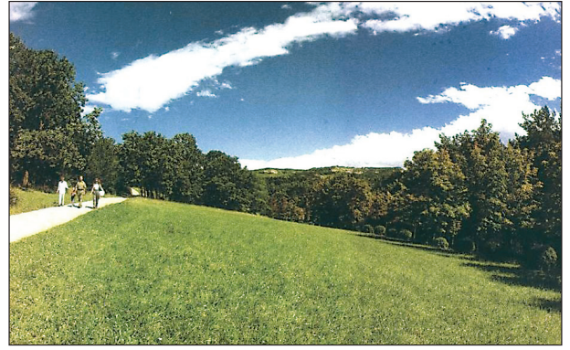
Рис. 2. Фрагмент ландшафта Кисловодского парка (фото Ю. Жванко. Я люблю тебя..., 1998).

В. К. Смирнов (1958) в своей книге описал лечебное значение Кисловодского лечебного курортного парка. Он, как и предыдущие авторы, считает, что максимальное пребывание отдыхающих в парке среди лесных насаждений, солнечных полян, покрытых травой, оздоравливает организм человека, чему способствует лечение ходьбой (терренкур). В. К. Смирнов указывает на лечебное значение парка и в зимнее время, так как солнечных дней здесь 300–330 в году. Этот парк пользуется славой не только у отдыхающих и жителей Кисловодска и других городов Кавказских Минеральных Вод или Ставропольского края, но и у жителей всей России. В период существования СССР летом Кисловодский парк был перегружен отдыхающими из Азербайджана, хотя в самом Азербайджане и по пути в Кисловодск –