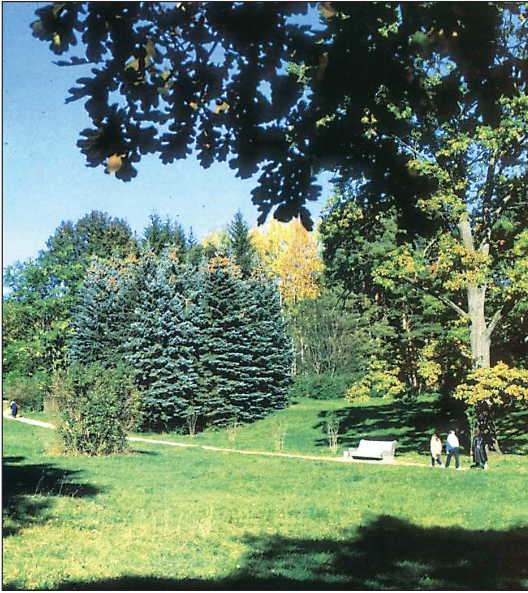
Рис. 1. Фрагмент ландшафта Кисловодского парка.

ха, – это Кисловодский лечебный курортный парк, площадь которого за последние два десятилетия уменьшилась на 432 га (рис. 1, 2).